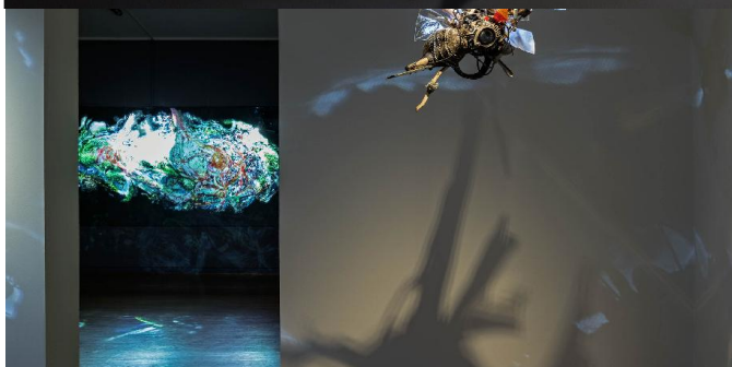
Blick in die Ausstellung mit den Werken Particle Selection , 2016, Videoskulptur, und Fossil , 2007, Videocollage © Jakub Nepraš